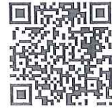
桃園市公立及非營利幼兒園 招生網

(三) 滿 3 足歲：105 年 9 月 2 日至 106 年 9 月 1 日出生者