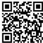
桃園市國民小學藝術才能美術班 鑑定線上報名系統