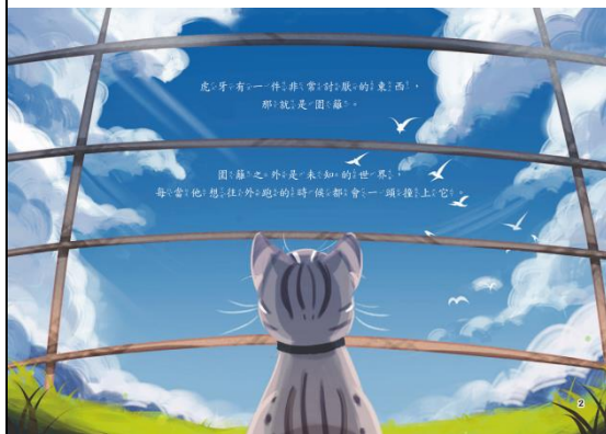
樣書範例(A4彩印加文字頁碼)