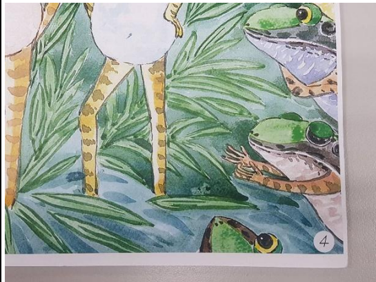
彩色影印樣書(編寫頁碼)