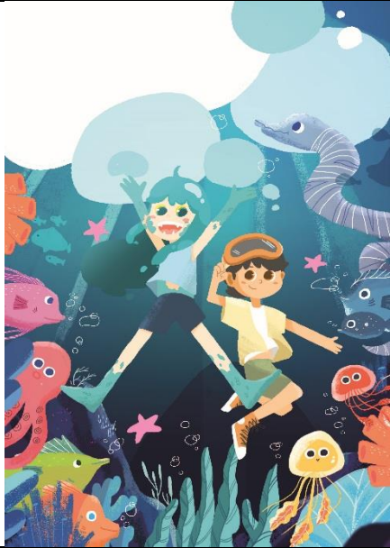
作品原稿(請勿書寫文字及頁碼)