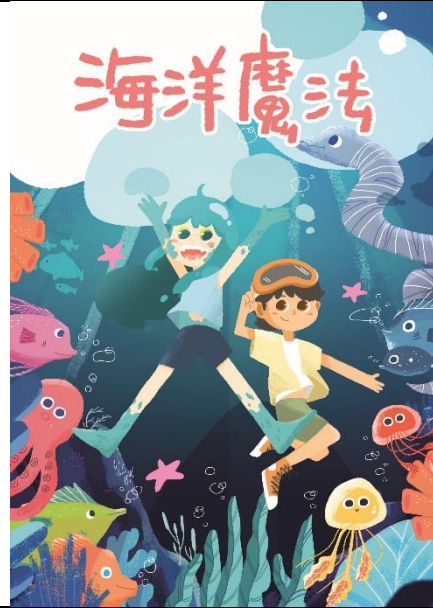
作品樣書(彩印加上文字)